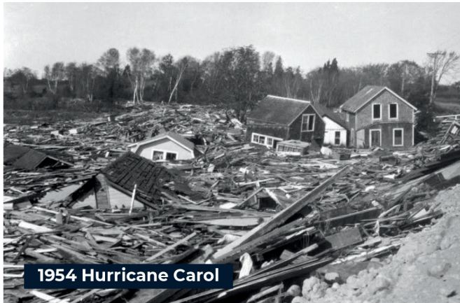
1954 Hurricane Carol

L'ouragan Carol de catégorie 3, avec des rafales de vent de 135 mph, a causé 68 décès et des dommages de 461 million $ en 1954.*